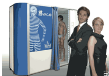
Sistema Symcad II.

Según la compañía, el realismo de la reconstrucción del cuerpo humano y el software permiten extraer todo tipo de medidas específicas de los puntos característicos del cuerpo. Las mediciones se efectúan sobre los datos brutos de la persona, sin manipulación ni filtrado.